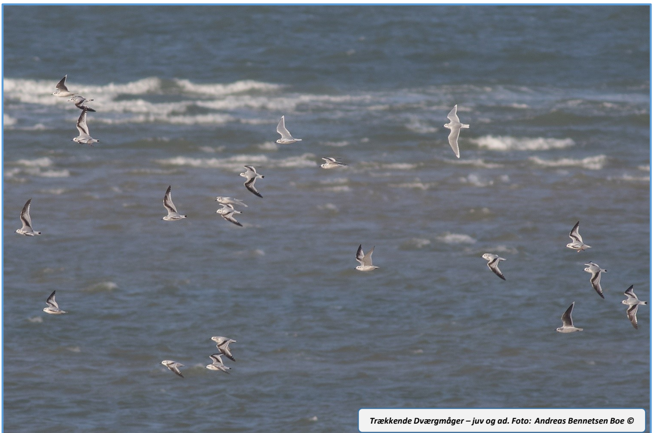
Trækkende Dværgmåger – juv og ad.

Den 2/11 var en helt igennem meget stor trækdag, og ud over Dværgmåger sås mere end 500 alkefugle, 343 Rider, 300 Rødstrubet Lom og 70 Kaspiske Måger.