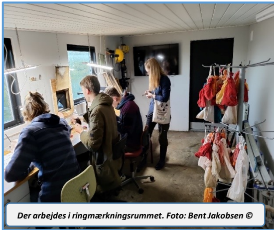
Der arbejdes i ringmærkningsrummet.

Årets første Karmindompap kom så sent som 5/6, og det blev til kun to observationer, hvoraf den ene var en genfangst af en hun ringmærket i 2020.