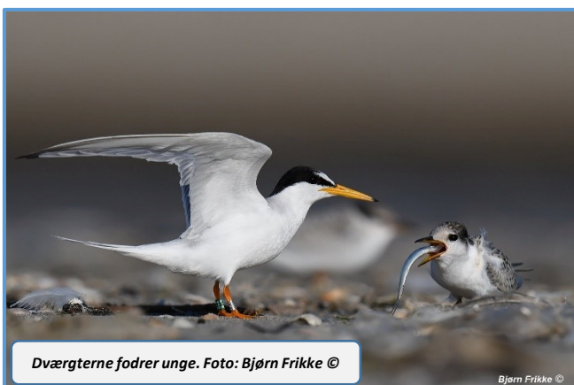
Dværgterne fodrer unge.

Vores 'udhegning' til strandens ynglefugle, som vi igen i år etablerede i samarbejde med Nationalpark Vadehavet og Forsvaret, blev en gedigen succes. I år blev hegningen opgraderet til et ræve- og hundesikkert hegn, og det betød, at turisterne respekterede det og at ikke mindre end 15 Dværgterneunger kom på vingerne. Også de Store Præstekraver benytter det beskyttede område til at yngle i. Den 5/7 sås på samme tid mindst otte store unger af Stor Præstekrave og minimum 10 unger kom på vingerne i løbet af sæsonen. Fire præstekrave-par som forsøgte at yngle uden for hegningen mislykkedes alle. I år var eneste problem et kraftigt højvande midt i yngletiden, som betød, at nogle store bjælker drev ind i hegnes vestvendte langside.