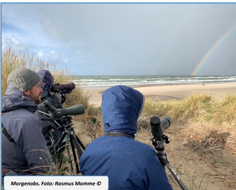
Morgenobs.