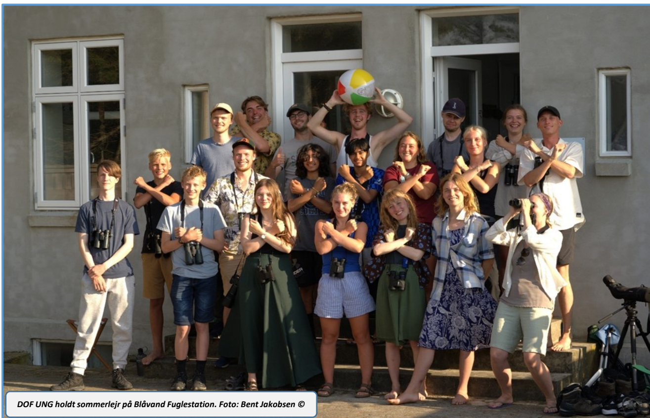
DOF UNG holdt sommerlejr på Blåvand Fuglestation.

20/7 trak i alt 4.182 vadefugle fordelt på 17 arter! Da vejret viste sig fra sin bedste side var der også tid til strandture med badning og rejefiskeri. Men det blev også til studier af natsværmere i vores ny fælde og nogle studerede floraen i området ved Blåvandshuk. En vellykket lejr, hvor der også var tid til afslapning. DOF UNG har heldigvis 'truet med' at komme igen til næste sommer, og det glæder vi os allerede til.