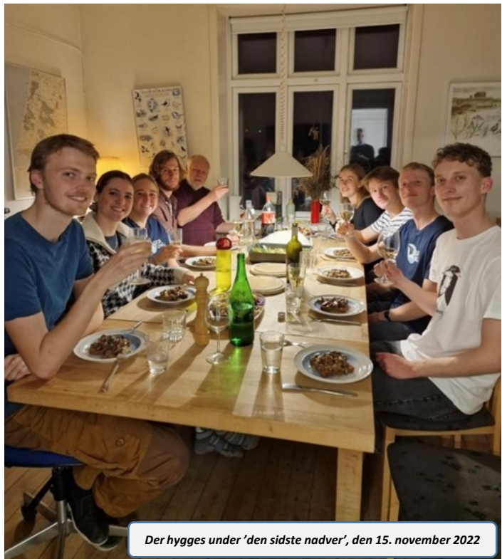
Der hygges under 'den sidste nadver', den 15. november 2022