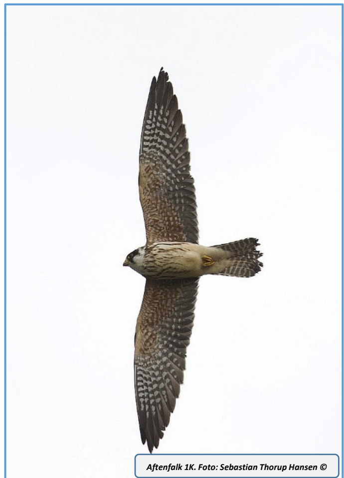
Aftenfalk 1K.

Den 20 - 24/10 lå en Amerikansk Sortand meget publikumsvenligt ved Sydhukket og ligeledes i uge 42 sås en fantastisk tillidsfuld ung Plettet Rørvagtel i havnegrøften på Grønningen. Denne sjældent sete men ofte hørte fugl kunne ses helt ned på 5 meters afstand. Desværre var der også nogle tyske turister, som morede sig gevaldigt med at kaste sten efter den, når den nu var så tæt på.