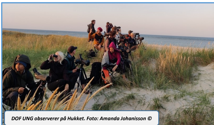
DOF UNG observerer på Hukket.

De sidste dage af oktober blev der i samarbejde med Statens Naturhistoriske Museum og Max Planck Institutet fra Tyskland taget otte Solsorte med sendere, så de kan følges og så vi hele tiden kan se hvor de befinder sig via mobilnetværket 'Sigfox'. Allerede efter nogle få dage var tre af dem