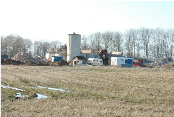
Siloen efter Bent