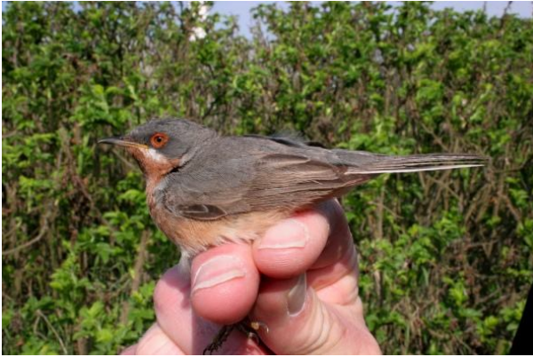
Sortstrubet Bynkefugl ringmærkes i tocifrede antal Sanger 18. maj