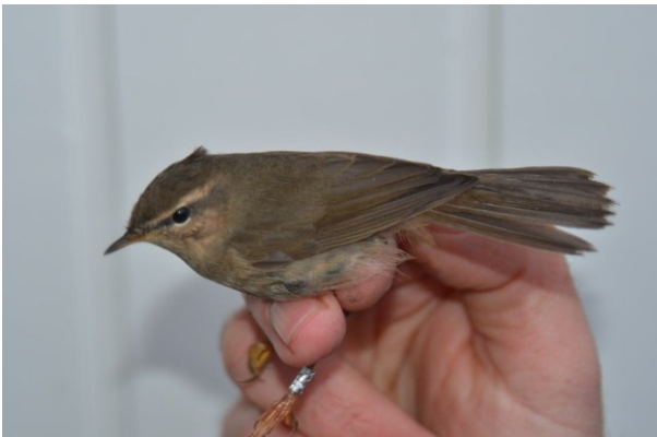
Schwartz Løvsanger 11/10 Brun Løvsanger 13-14/11