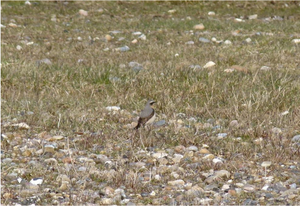
Stenpikker på Grønningen. Hele tre blev set i Blåvand i dag.