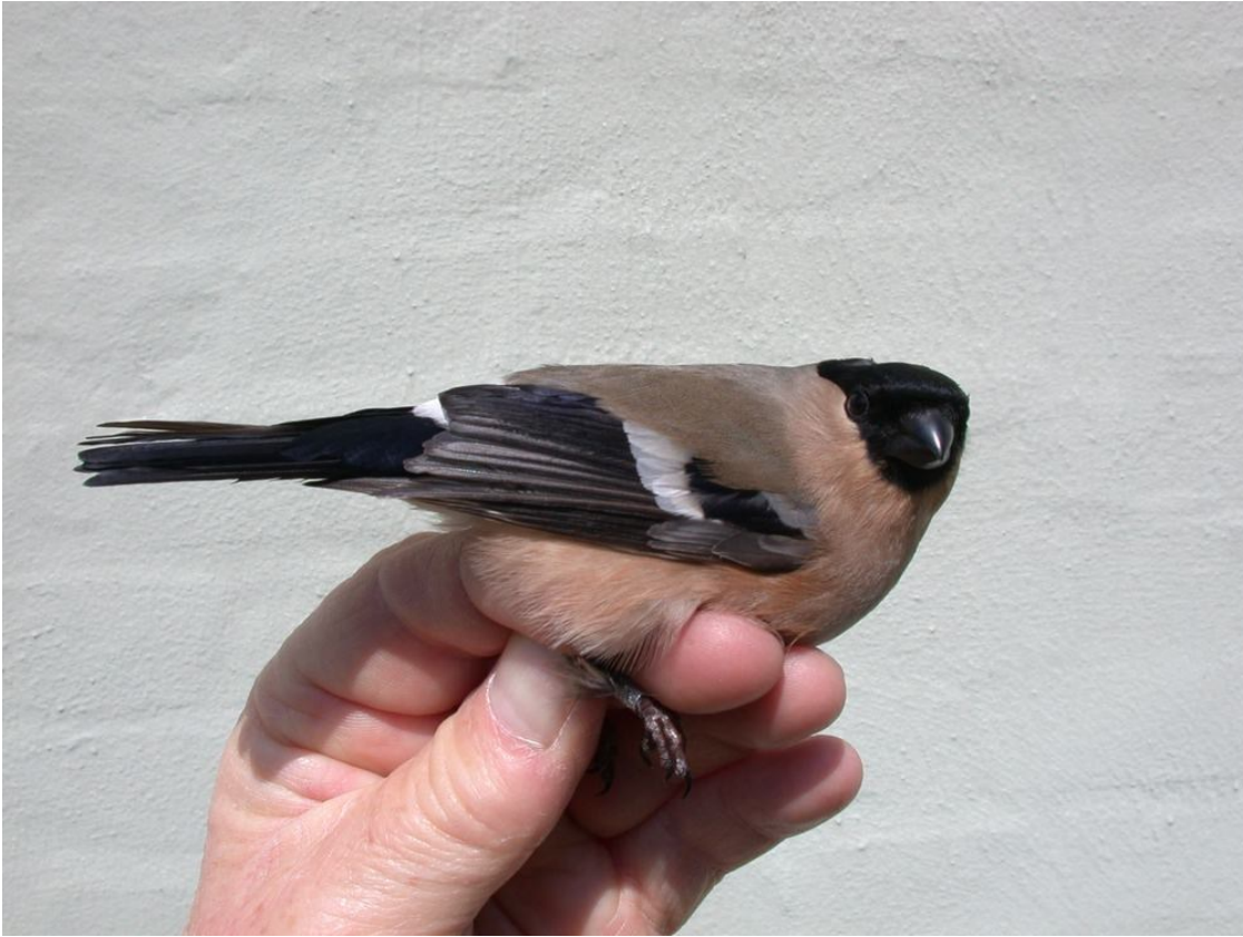
Lille Dompap hun (P.p. europaea) vinge 81 mm