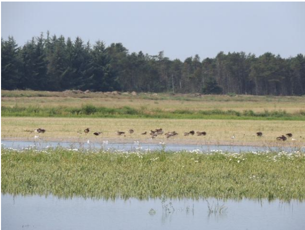
Fuglene har taget det nye område i brug