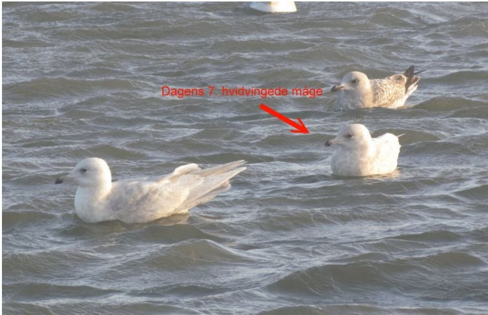
2 gange 3k