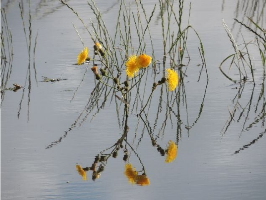
En svinemælk med fødderne i vand