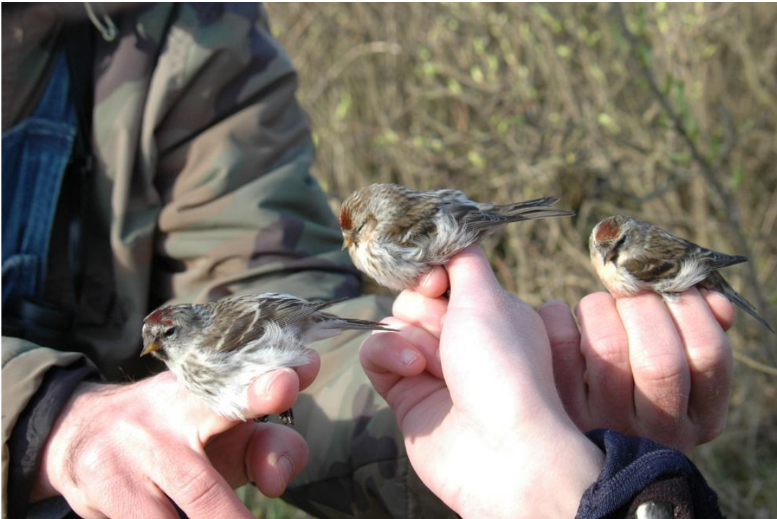
Lys Stor gråsirken, Mørkere Stor gråsirken og Lille Gråsirken