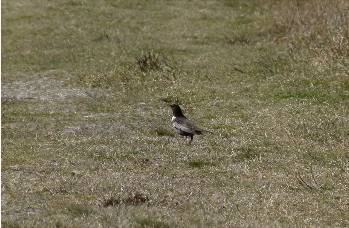
Ringdrossel // Ring Ouzel