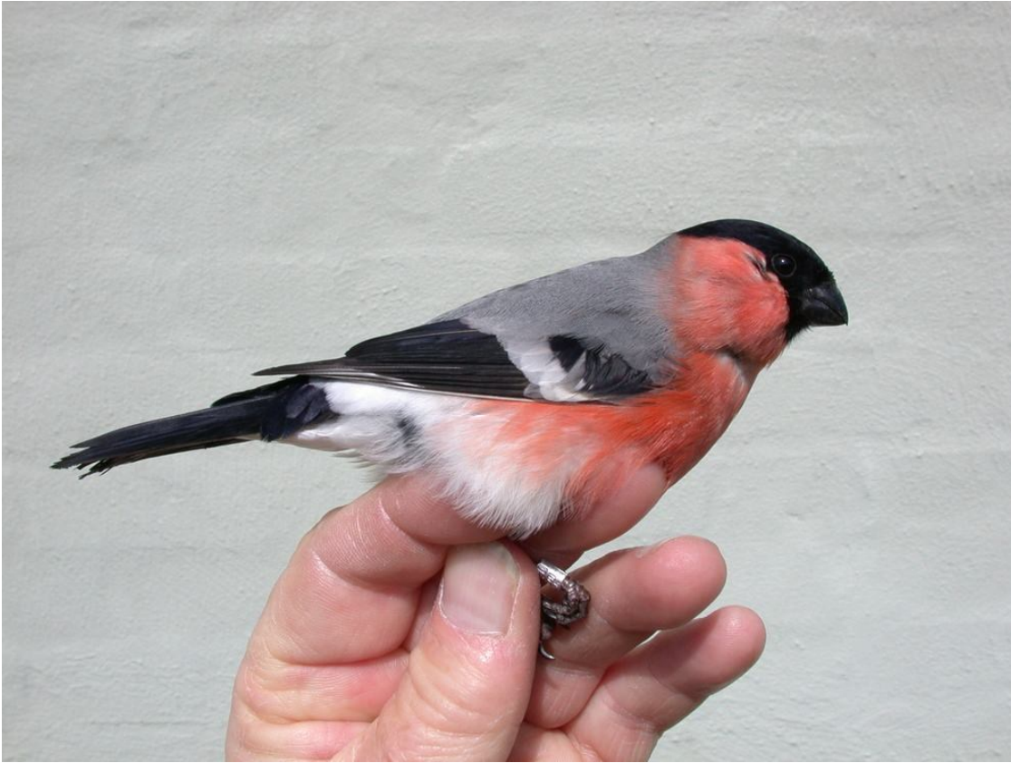
Lille Dompap han ( P.p. europaea ), vinge 84 mm