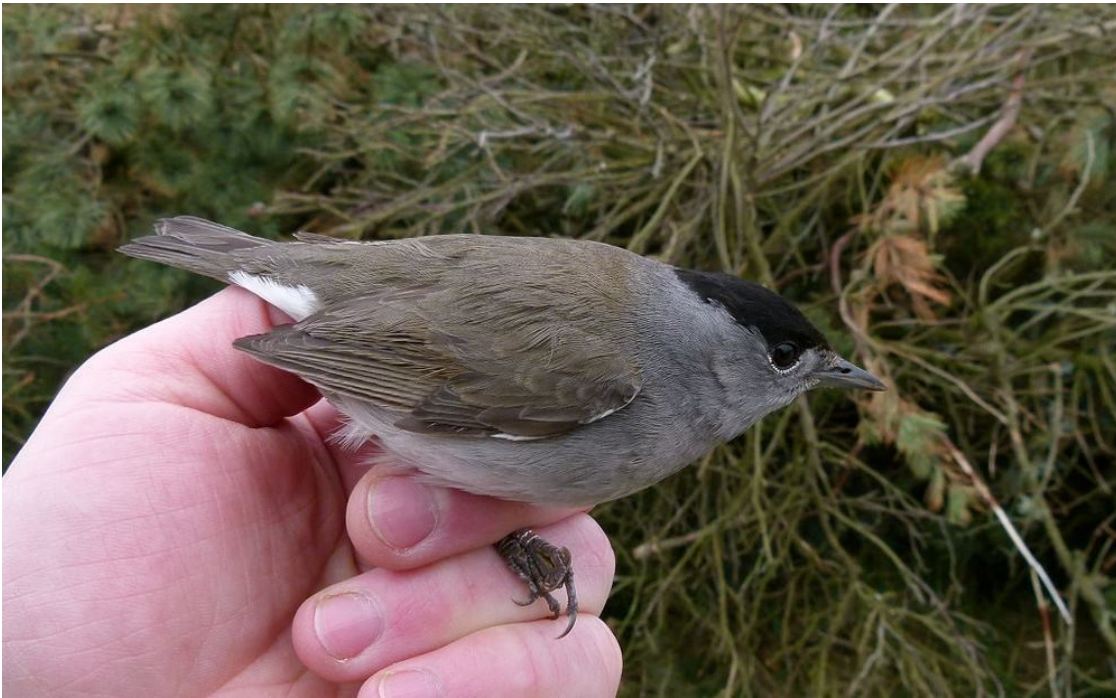
Årets første Munk

I forhold til i går var Blåvand i dag ret fugletom. Ringmærkningen var sløj og der var kun få småfugle i krattene. Ringmærkningen gav 21 fugle i dag. Gransanger var talrigest med 7 fugle, næsten alle på anden runde. Vi fik dog også en ny ankomst: Munk. Mellem runderne havde jeg tid til at kigge lidt over havet. Der kom lidt Splitterner og årets anden Almindelige Kjøve. Morgenen gav også årets første Havterner. Efter de fem timer lukkede jeg fyrhaven. Jeg læser lige nu til eksamen, så jeg lod stationshaven være åben til lidt adspredelse. Det gav dog kun et par små gråsiskener og en Bogfinke. Efter ringmærkningen kørte jeg lidt rundt i i mosen og ved slugerne. Jeg fandt hele 11 Sortstrubede Bynkefugle (heraf 7 syngende hanner) og 4 Stenpikkere. En tur på stranden var en skuffende omgang, men der gik 70 Sandløbere - en art vi ikke har set meget til i år. //HBØ