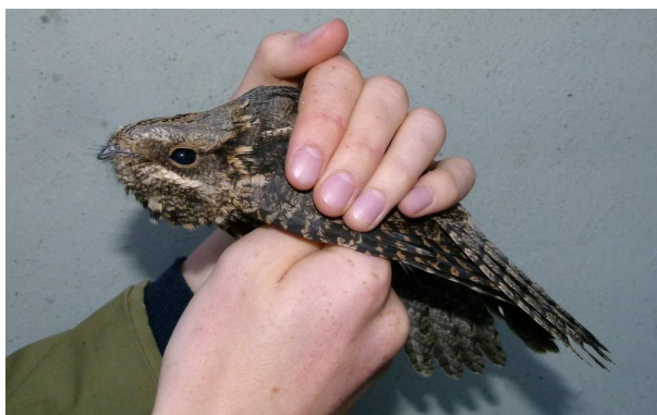
En sjælden gæst i nettene Bonapartemåge 4-5. august