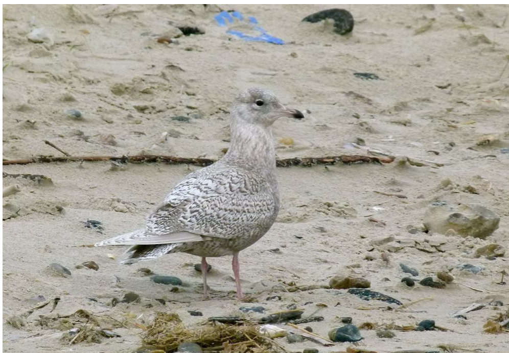
2k Hvidvinget Måge

Planen var igen at lede efter hvide måger. Jeg lagde ud fra solopgang med at gå ned til Lille Strandvej og ville så bevæge mig nordpå op til sabinebunkeren. Der var pænt med måger på stranden og håbet var højt. Jeg havde taget skopet med, så jeg kunne tjekke ænder på min vej. De næste timer var dog noget af en skuffelse. Indtil kl. 14 havde jeg gået fra Lille Strandvej til sabinebunkeren, tilbage gennem mosen og videre ned på sydhukket igen. Det eneste jeg havde set var en 2k Kaspisk Måge. Jeg var næsten nået op til pælerækken igen, da jeg får øje på en lysende fugl næsten oppe ved foden af kiltten. Det var en 2k Hvidvinget Måge . Dagens første og eneste. Fuglen letter og flyver ned på sydhukket. Jeg følger efter og måder HEB, der også havde set mågen. På sin sædvanlige tur så Bent i dag en Duehøg. Den fik alle mågerne på vingerne. Duehøg er en sjælden gæst på hukket. //HBØ