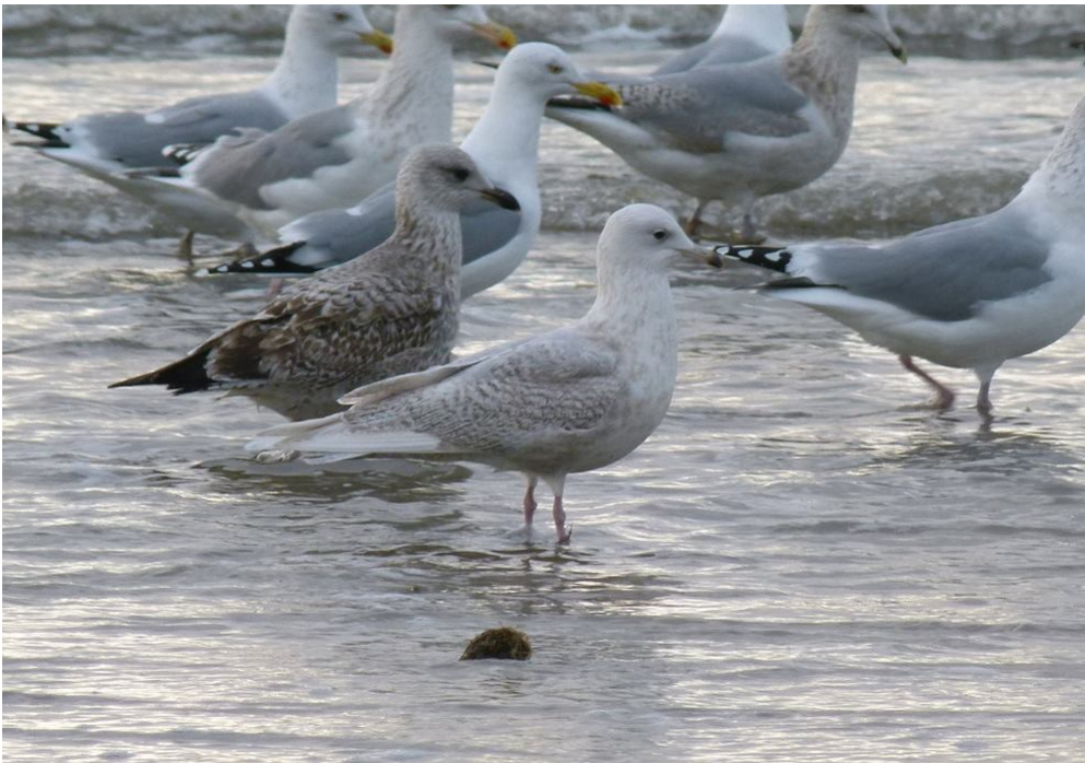
Dagens 3k Hvidvinget Måge