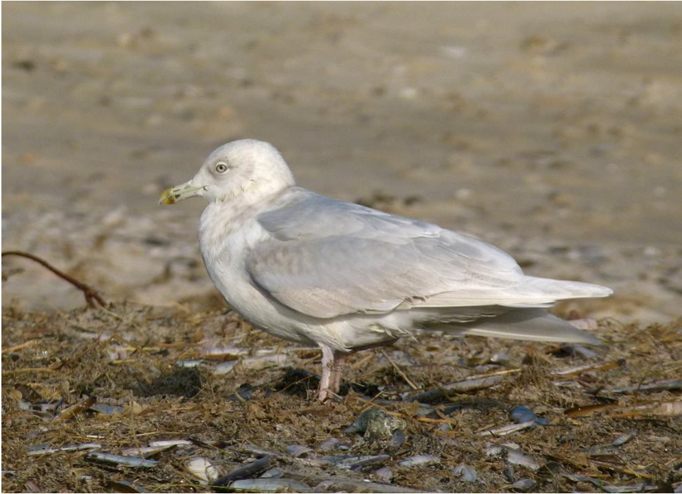
4k kumliens?