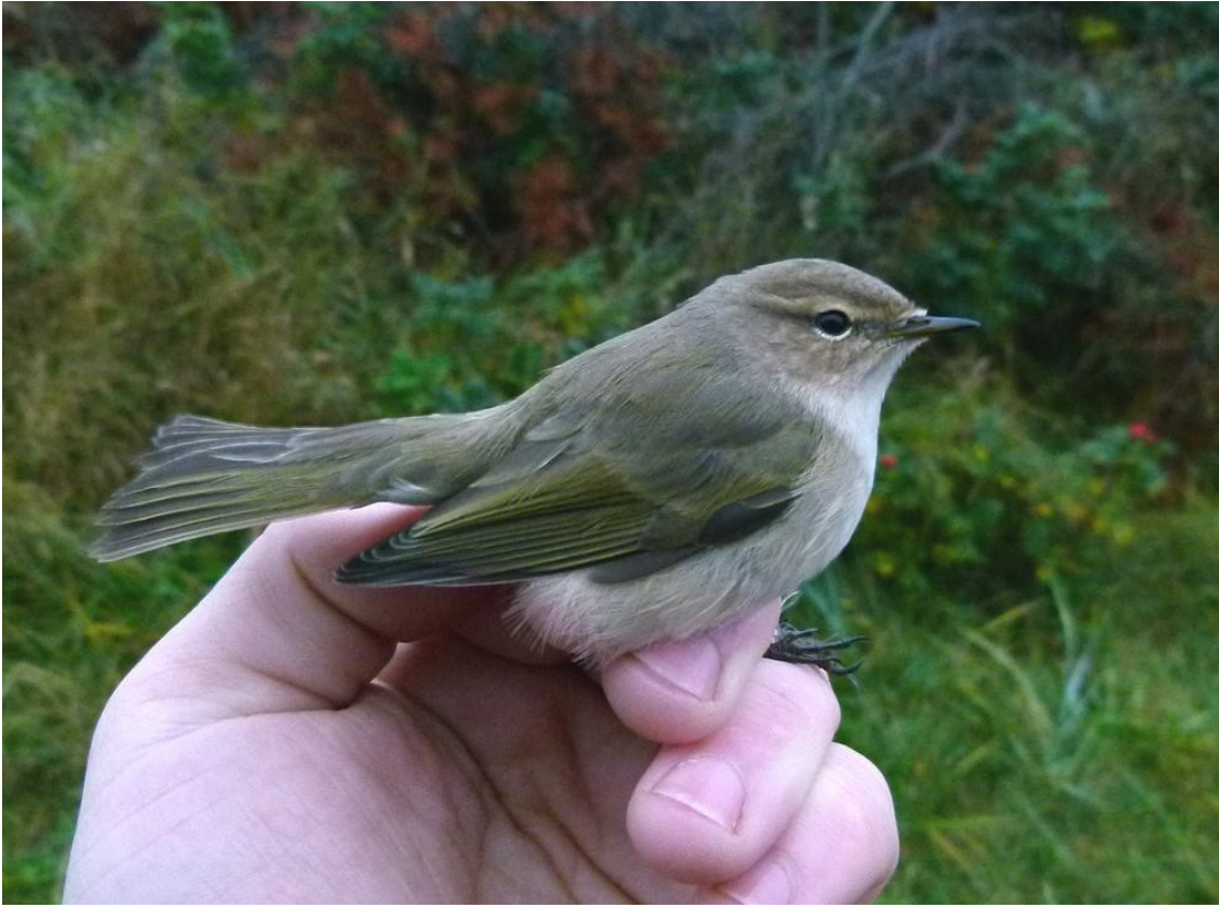
Sibirisk Gransanger (Tristis)