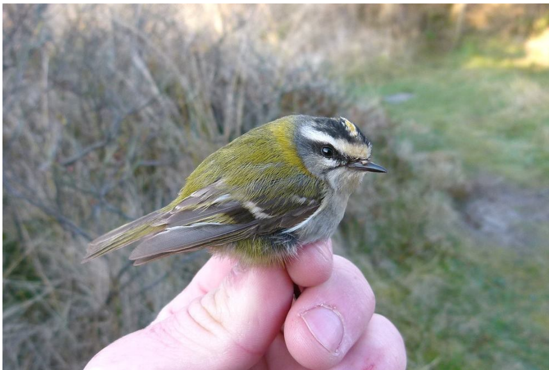
Rødtoppet Fuglekonge // Firecrest

det store rykind. Sightings: 2 Black-throated Divers, 2 Actic Skuas, increasing numbers of Little Terns, Firecrest and a Serin. //HBØ