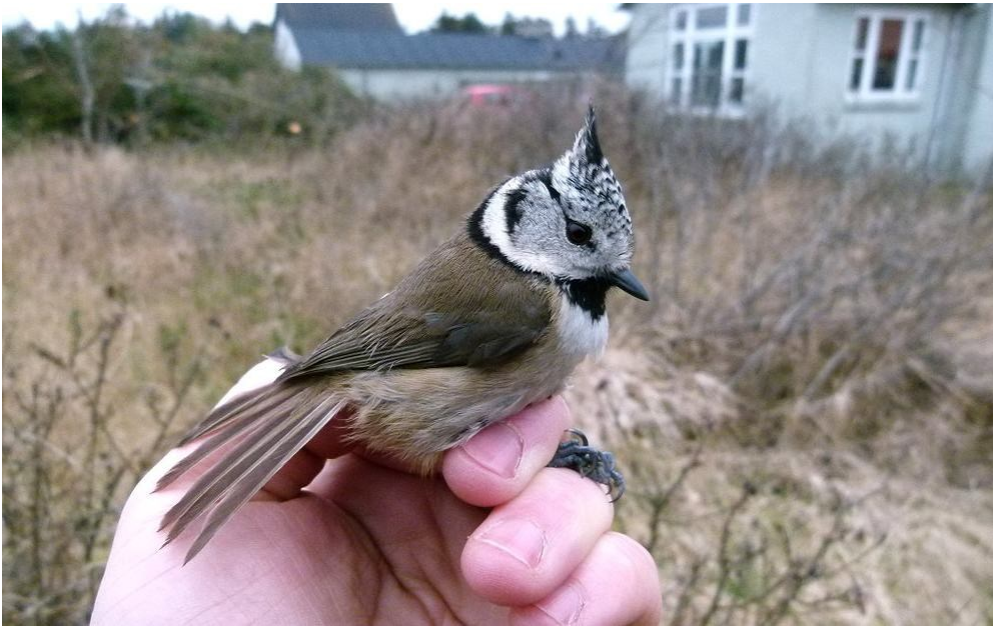
Genfangst, med ringserie fra Blåvand