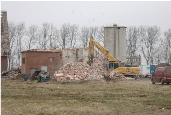
Siloerne på vej væk