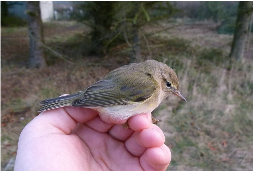
Årets første Grans

Omkring kl. 11 gik vinden i VSV og der lagde sig et tykt tæppe af tåge over hukket. Man kunne ikke engang se fyret fra stationen. Samtidigt blev alle småfugle inaktive, så jeg lukkede nettene. I stedet brugte jeg eftermiddagen på at ordne haven. Græsset var ikke blevet slået siden starten af sidste efterår, så trængte til en ordentlig tur. Også de nyspirede rosenstængler fik en tur med græsslåmaskinen. Det er den eneste måde at komme dem til livs. Dagens obs blev 3 Hvidvingede Korsnæb. Jeg var på runde i fyrhaven, da jeg hører et kald, hvor jeg straks tænker Hvidvinget Korsnæb. Og det lyder som om der er mere end en. Det er svært at få øje på dem oppe mod den blå himmel, men jeg finder dem til sidst nord for fyren. Jeg når desværre kun at se én fugl godt. Det er nok første forårsfund for Blåvand. //HBØ