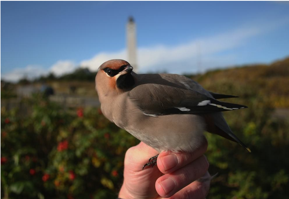
Silkehale 1k hun