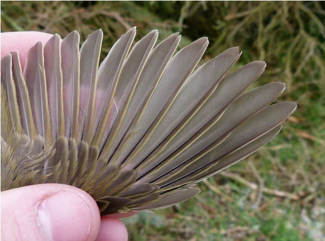
Sydlig Gransanger // Chiffchaff ssp. collybita