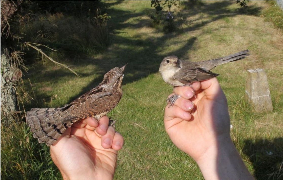
Resultatet af dagens drømmerunde: Vendehals og Høgesanger.