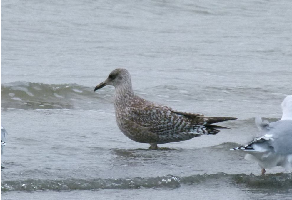
2k Sølvmåge med deformt næb.