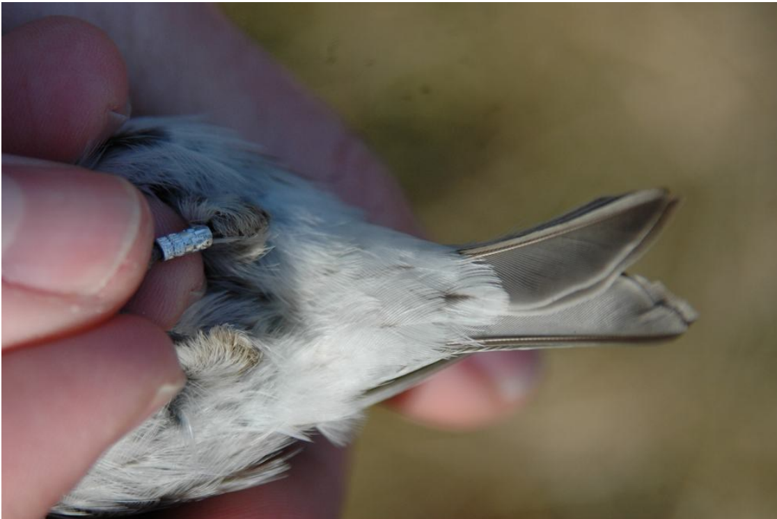
Undergump af lys Stor Gråsisken