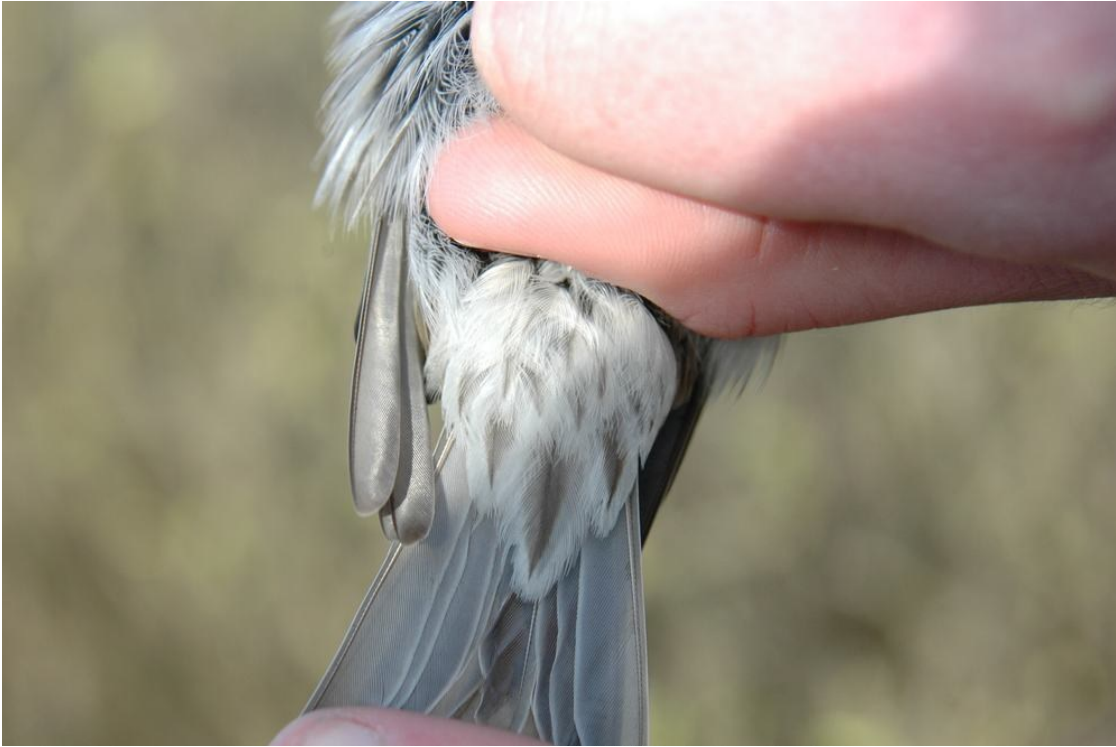
Undergump af mørk Stor Gråsisken