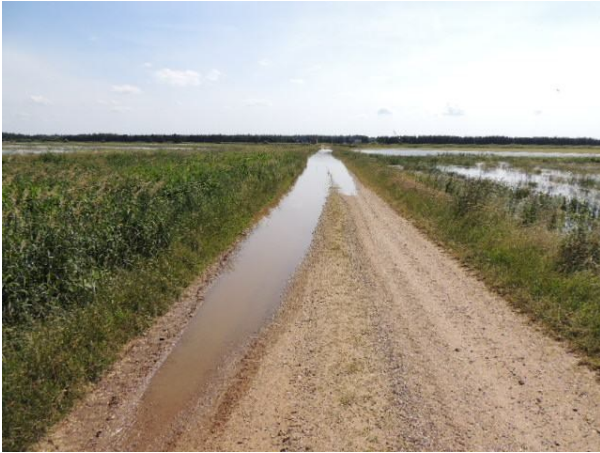
5. juli 2012. Vandet erobrer den første grusvej.