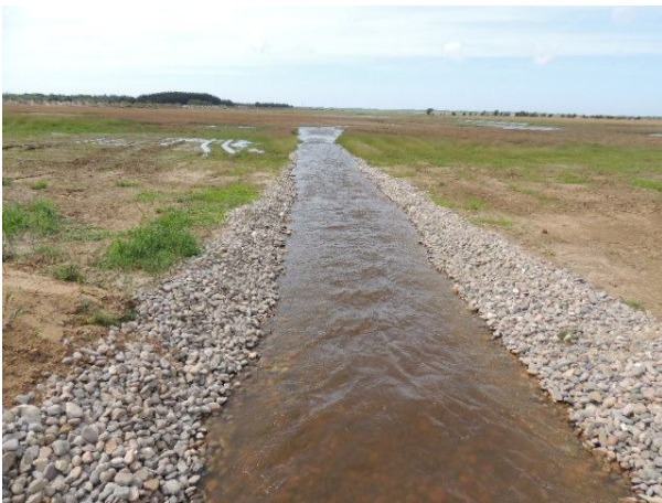
2. juli 2012. Så er det en realitet, vandet fosser ind i Filsø