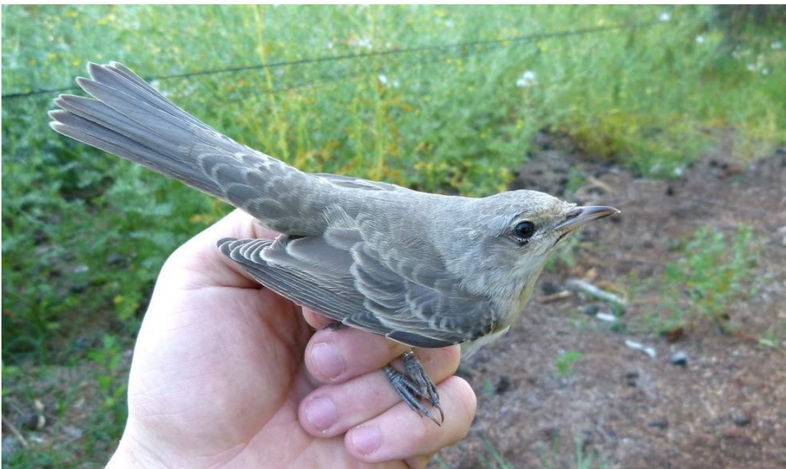
Høgesanger, 1k ringmærket