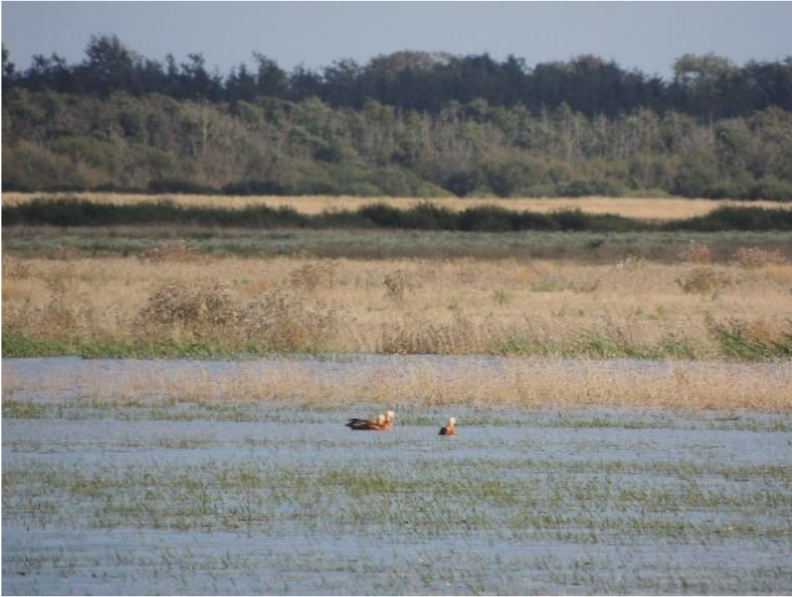
3 af 4 Rustænder