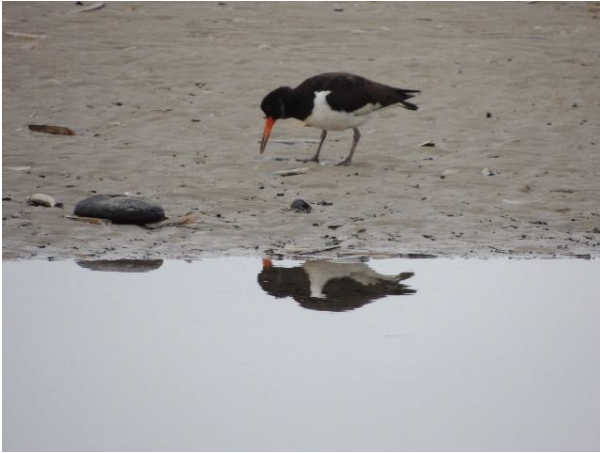
Fouragerende Strandskade på stranden