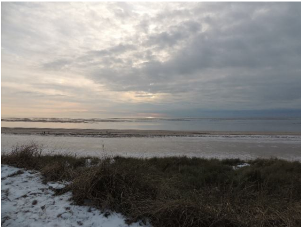
Snestormen tårner sig op i horisonten