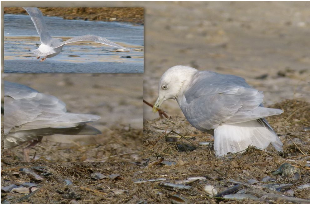
4k kumliens?