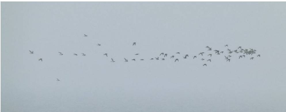
Forårs-skader på Sydhuuket. Mere end 300 trak om eftermiddagen