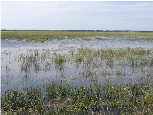
5. juli 2012. Vandet erobrer en hvedemark.