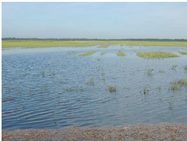
Samme hvedemark fotograferet fra samme position d. 7. juli 2012