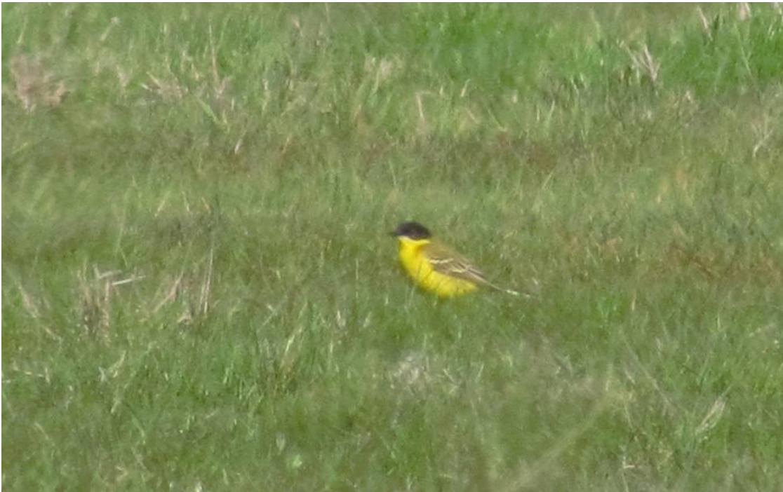
På dette foto ses den lyse stribe fra næbbbasis mere tydeligt. Grønningen maj 2012.