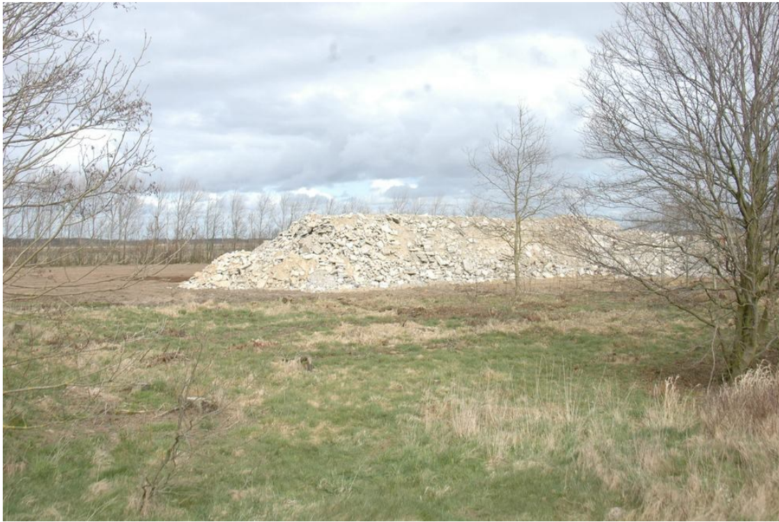
Her ligger resterne af svinefarmen :-)