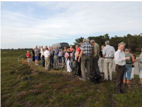
Omkring 1500 mennesker er guidet og har fået orientering om projektet. Her en del af 270 landmænd d. 5. juli 2012. Bent