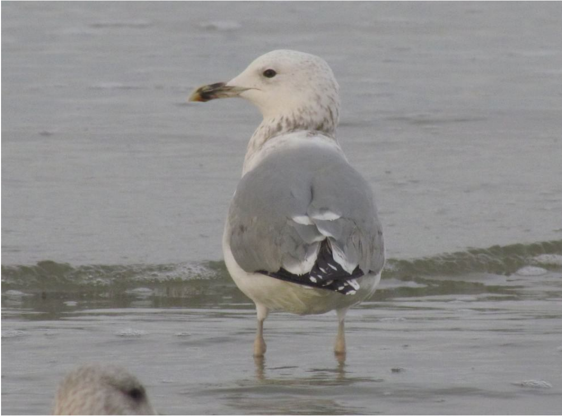
Kaspisk Måge 3. vinter.