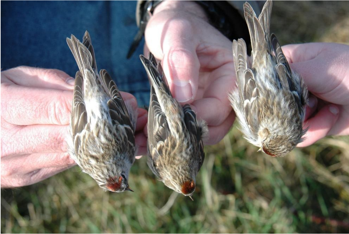
Lys Stor Gråsirken, Lille gråsirken og mørkere Stor Gråsirken