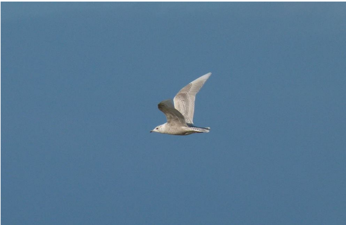
Hvidvinget Måge 2k // Iceland Gull 2cy

talrigest. Igen i dag røg en Stillits i nettet. Super fed fugl i hånden. Da jeg kom tilbage til stationen efter første netrunde blev min opmærksomhed rettet mod en svirrende mekanisk fra krattet på den anden side af vejen. Jeg tænkte Græshoppesanger , men jeg syntes ikke den lyd helt rigtig. Jeg optog stemmen, men efter en sammenligning med andre locustella'ers sang, kunne jeg kun få det til en almindelig Græshoppesanger. Ret tidlig obs. Mellem runderne satte jeg mig igen ned på Sydhukket for at holde lidt øje med havet. Der var godt gang i Stormmågerne og lid Suler trak nord. Derudover kom der en Sortstrubet Lom, 2 Sortryggede Vipstjerter og 3 Dværgterner, hvilket er de første på hukket i år. På stranden stod der pludselig en 2k Hvidvinget Måge . Det er ved at være en måned siden der sidst har været hvide måger i Blåvand. Mon ikke det er den sidste i foråret? En tur i mosen gav en Ringdrossel og 5 Stenpikkere, men ellers var der ret fugletomt. Sightings: 3 Black-throated Divers, many migrating Common Gulls, Iceland Gull on the beach, first Little Terns, 2 Pied Wagtails, Ring Ouzel and an early Grasshopper Warbler. HBØ