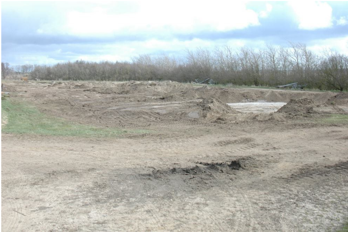
Her stod 4 store gyllebeholdere :-)