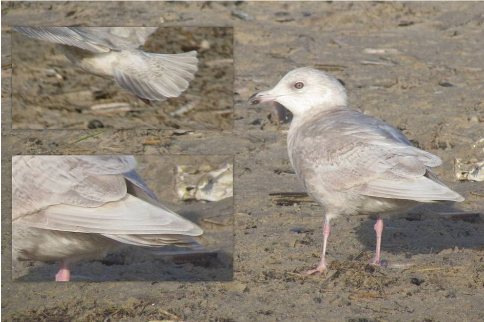
3k kumliens?