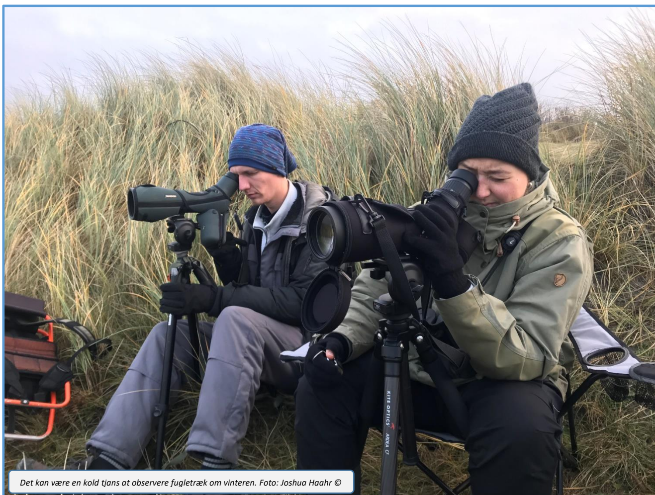
Det kan være en kold tjans at observere fugletræk om vinteren.

Da vi startede forårssæsonen 2021 var der fra 1. marts en rigtig god bemanning. Minimumsprogrammets standardiserede ringmærkning blev frem til 1. april dækket af Jacob Colemann Nielsen, hvorefter Samuel