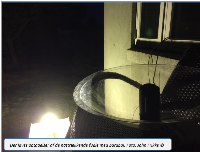
Der laves optagelser af de nattrækkende fuale med parabol.

De store mængder af Sortænder med op til 30.000, som tidligere har ligget ud for Hukket om vinteren, har ikke været til stede de seneste par år, og i år blev det kun til et maksimum på 320. Til gengæld sås mange forbi-trækkende, f.eks. med 4.431 den 31/3.