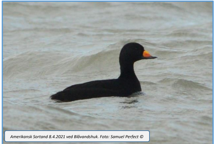
Amerikansk Sortand 8.4.2021 ved Blåvandshuk.

April måneds overraskelse var uden tvivl en Almindelig Skråpe, som passerede mod syd den 13/4. Det er første april fund for Blåvandshuk.