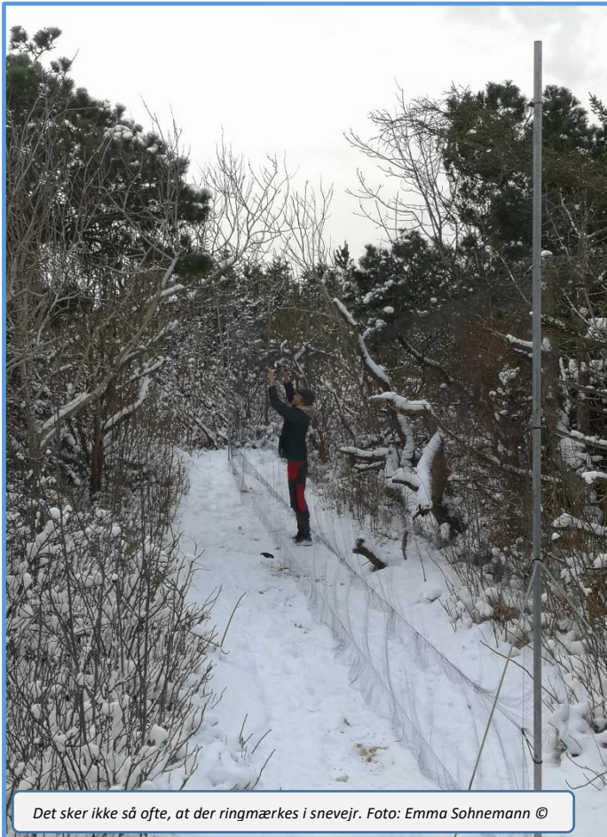
Det sker ikke så ofte, at der ringmærkes i snevejr.

Perfect fra engelske Dover tog over og står for ringmærkningen frem til slutningen på sæsonen. Vi har med de to haft en god og kvalificeret ringmærkning, men desværre var foråret præget af en del dårligt vejr og kulde. Det dæmpede både mulighederne for at ringmærke, men betød også, at antallene af de tidlige forårstrækkere var relativt lave.