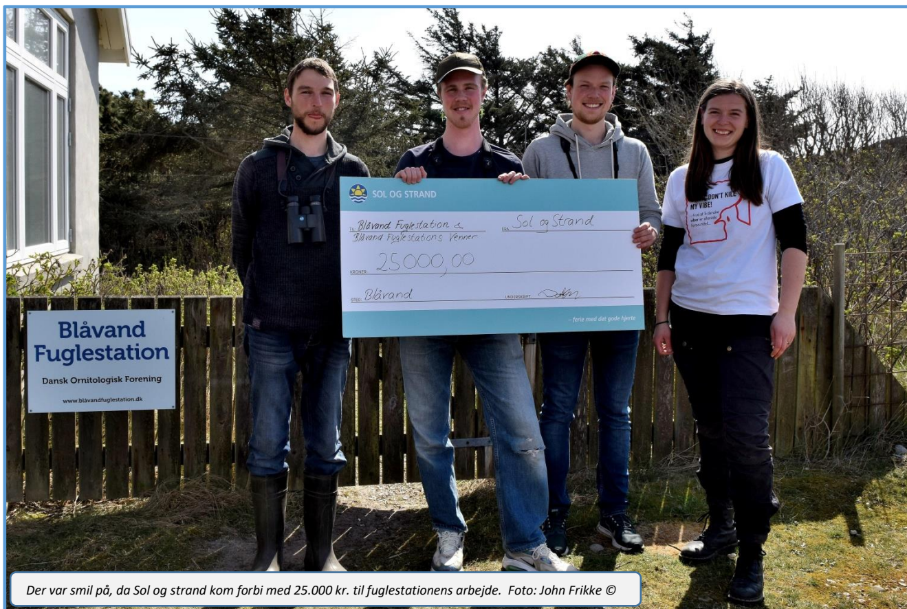
Der var smil på, da Sol og strand kom forbi med 25.000 kr. til fuglestationens arbejde.

I forhold til at øge aktivitetsniveauet på Blåvand Fuglestation kan det nævnes, at der i perioden er indløbet et tilskud fra sommerhusudlejningsfirmaet 'Sol og Strand', som synes godt om Blåvand Fuglestation og den formidling, som udgår fra stedet. Disse bidrag er af meget stor betydning, og der lyder en stor tak for dem. Desuden er vi fortsat ved at omsætte en flot bevilling fra Friluftsrådet til forbedringer af formidlingen af fuglestationen, fuglestationens arbejde og fugletrækket og dets gåder.