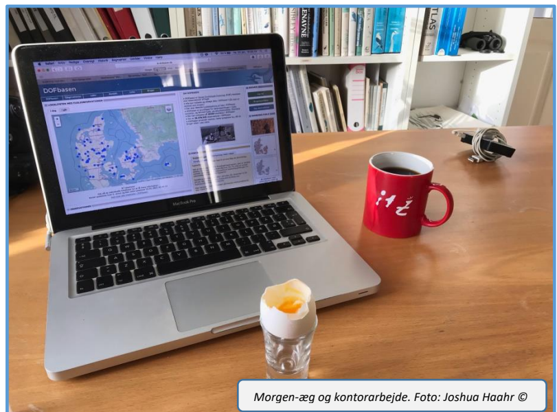
Morgen-æg og kontorarbejde.