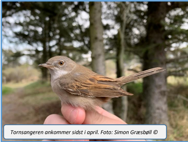
Tornsangeren ankommer sidst i april.

Rosa rogusa-rydningen i de mest 'angrebne' klitter på Hukket blev genoptaget i vinter, og ligeledes har forsvaret fjernet meget Rosa rogusa inde på deres område med henblik på at begrænse væksten af denne invasive art.