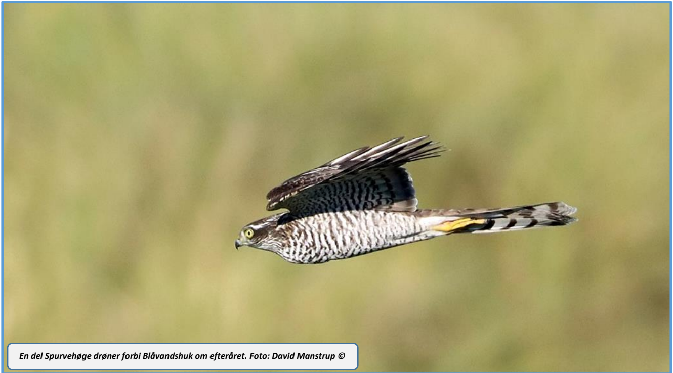
En del Spurvehøge drøner forbi Blåvandshuk om efteråret.

uden tvivl en Isabellastenpikker (14/11), som er 2. fund for Blåvand-området og 3. observation i Danmark, samt Schwarz Løvsanger (18/10) som var 7. fund for Blåvand-området. Og så er det nok første gang nogensinde, at der blev noteret flere Fuglekongesangere (3) end Hvidbrynede Løvsangere (2) på Hukket.