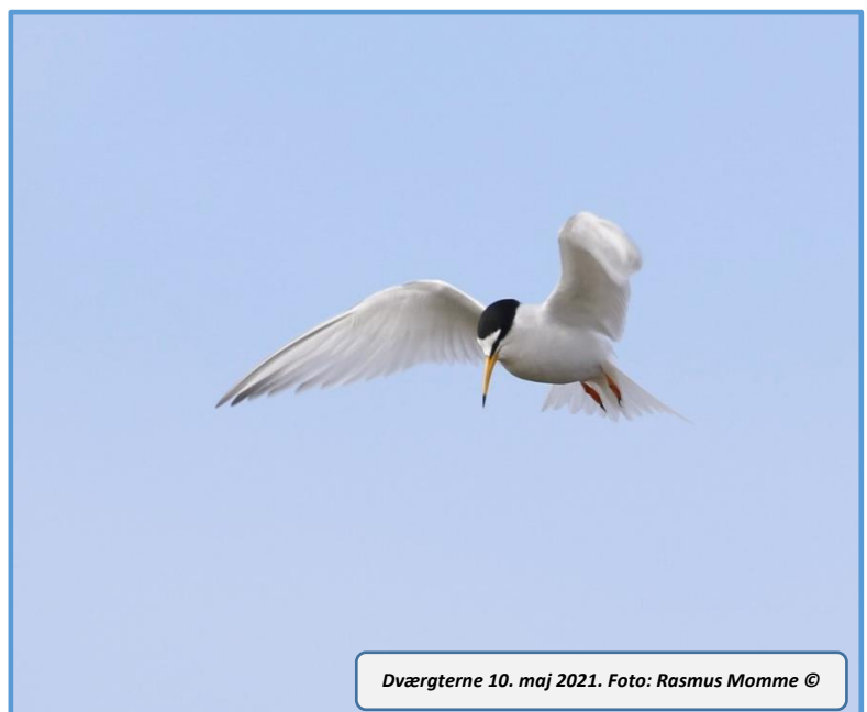
Dværgterne 10. maj 2021.

Fire Gulirisker og flere Karmindompapper aflagde også besøg i haverne. På vores natoptagelser 11/5 blev der registreret en syngende Sydlig Nattergal i den meget tidlige morgen. Men det blev også til sjældenheder som Markpiber 3/6 og Rødhovedet Tornskade 5/6 i Ål Plantage ved Oksbøl.