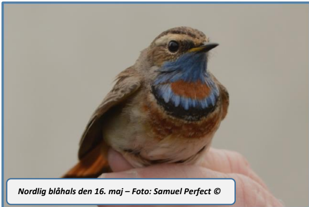
Nordlig blåhals den 16. maj