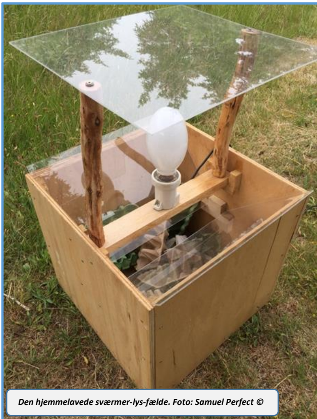
Den hjemmelavede sværmer-lys-fælde.

Samuel byggede i foråret en kasse til at lyse natsværmere ind med, hvilket var noget helt nyt i fuglestationens regi. Det var fantastisk, at se især de store natsværmere sidde på æggebakkerne i kassen! Samlet set var der rigtigt mange, og alle blev bestemt og noteret med art og antal. Merit Lenk er i øjeblikket ved at indtaste alle natsværmerobservationer henover foråret/sommeren 2021 i Naturbasen.