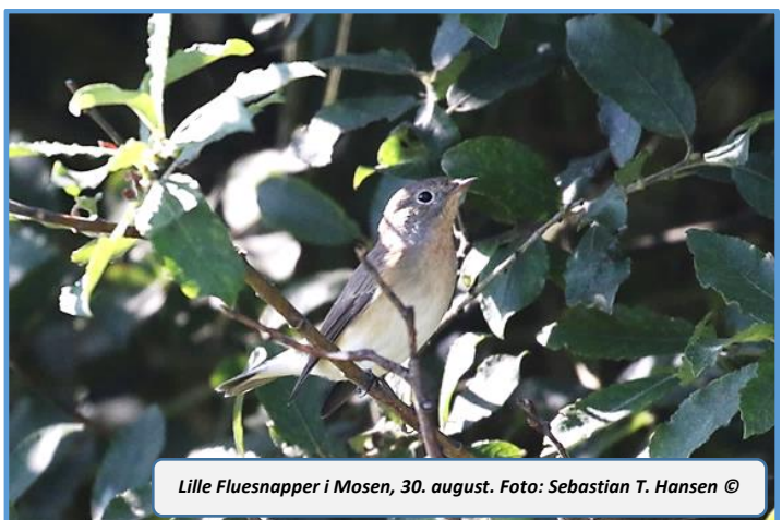
Lille Fluesnapper i Mosen, 30. august.