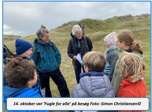
14. oktober var 'Fugle for alle' på besøg

I ringmærkningen fik alle besøgende set fugle i hånden og fremvist hvordan ringmærkning foregår. To så spændende arter som Vende-hals og Rødrygget tornskade kunne fremvises og det vækker jo altid glæde. Vi er overbeviste om at de besøgende gik fra fuglestationen med en god oplevelse rigere. En stor tak til vores personale og frivillige hjælpere for at gøre dagen så god og spændende for vores gæster.