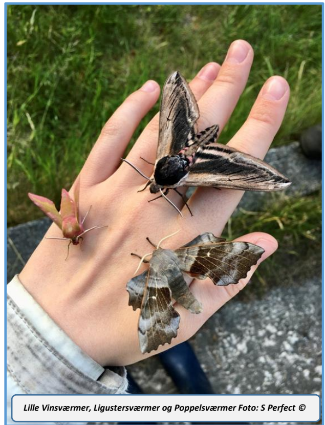
Lille Vinsværmer, Ligustersværmer og Poppelsværmer

Strandskadens Dag den 1. august blev en stor succes. Vi havde igen lånt informationstraileren fra Nationalpark Vadehavet, som stod på vores P-plads. Ca. 100 mennesker besøgte os på fuglestationen, hvor vi kunne fortælle om Strandskadens træk, Vadehavets betydning og fremvise ringmærkning. Vores folk på stranden havde også rimeligt travlt med 25-30 besøgende, som alle fik set trækkende Strandskader, idet 1.092 passerede Blåvandshuk denne søndag.