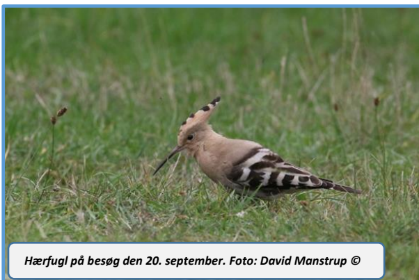
Hærfugl på besøg den 20. september.

Med to observationer er den smukke Sabinemåge heldigvis ved at blive årlig igen.