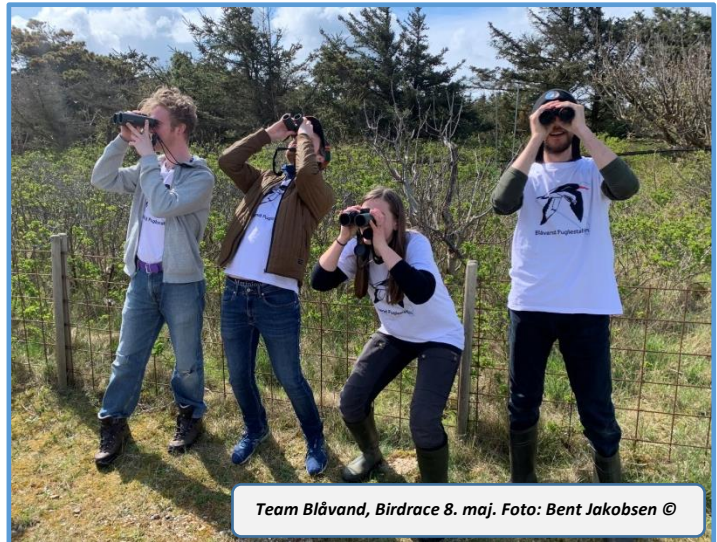
Team Blåvand, Birdrace 8. maj.

I begyndelsen af maj lagde omkring 15 par Dværgterner op til at yngle på Blåvandshuk ikke langt nord for Pælerækken, og da de tydeligt viste hvor de ville slå sig ned, satte personalet en 'markeringsindhegning' med tilhørende skilte op om kerneområdet. Det skete den 21/5 og igen som et led i Nationalpark Vadehavets Kystfugleprojekt. Desværre kneb det gentagne gange med at få strandens gæster til at respektere hegningen, og der kom ingen Dværgterne-unger på vingerne i år. Derfor er det nu aftalt med nationalparken og Forsvaret, at der til næste år sættes et strømførende og ræve-/hundesikkert hegn op om området, så de små terner forhåbentligt får noget ud af deres mange anstrengelser!