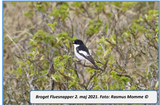
Broget Fluesnapper 2. maj 2021.