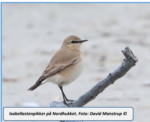
Isabellastenpikker på Nordhukket.

På Nyeng blev der foretaget nogle enkelte træktællinger, hvoraf bør nævnes den 18/10 med Sang/Vindrossel 12.020 og Ringdrossel 42. Den 3/11 trak 36 Musvåger på 2 timer, hvilket er mange her i det vestjyske.